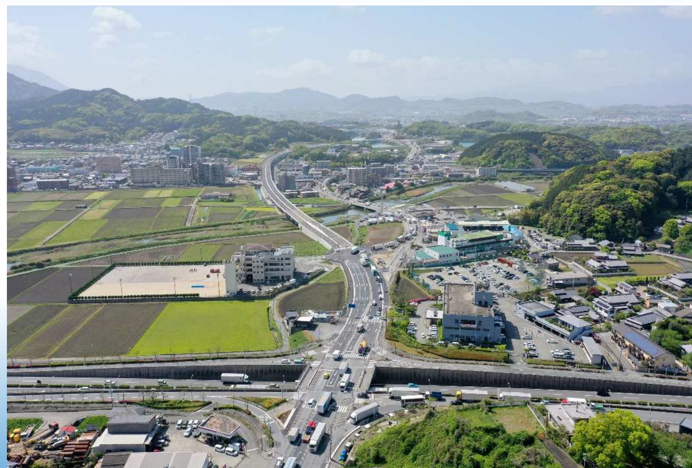
終点側上空より南向きに撮影 (R5.4.17)